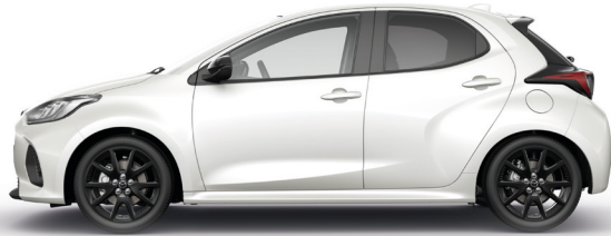
NORTHERN WHITE PEARL (48D) 2)