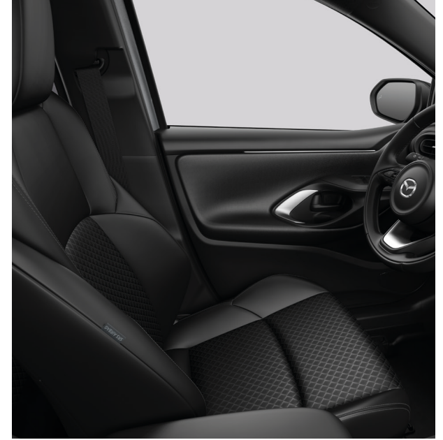
Sportsitze in Schwarz für Homura und Homura Plus*