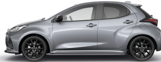
LEAD GREY (48G) 1)