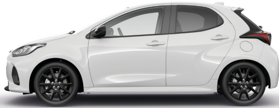
LUNAR WHITE (A8D)