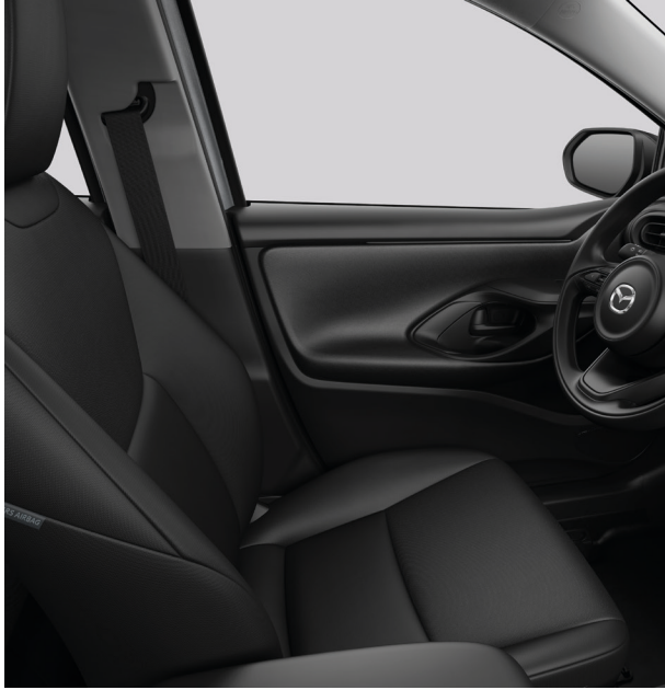
Stoffpolster in Schwarz für Prime-Line