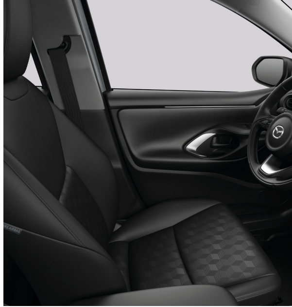
Stoffpolster in Schwarz für Centre- und Exclusive-Line