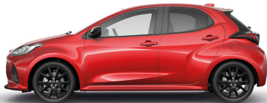
FORMAL RED (A9V) 2)