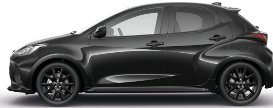
OPERA BLACK (49W) 1)