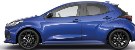
GLASS BLUE (50G) 1)